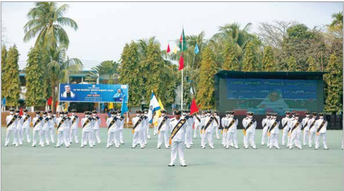
মুজিব শতবর্ষ উপলক্ষে গ্র্যাজুয়েশন প্যারেডে অংশগ্রহণকারীগণ