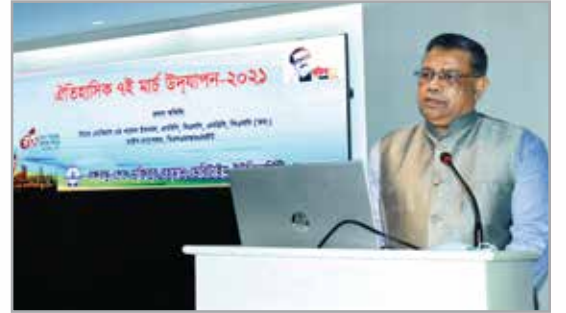
অনুষ্ঠানে বক্তব্যরত উপাচার্য মহোদয়