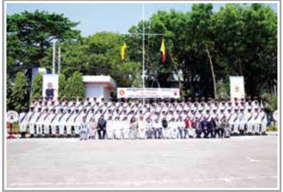
Group Photo of 40 th Batch

পাশকৃত ৩৯তম ও ৪০তম ব্যাচের নটিক্যাল বিভাগ হতে ৬০ জন, মেরিন ইঞ্জিনিয়ারিং বিভাগে ৬১ জন ক্যাডেটসহ সর্বমোট ১২১ জন ক্যাডেটদের অনুকূলে নৌপরিবহন অধিদপ্তর কর্তৃক Continuous Discharge Certificate (CDC) ইস্যু করা হয়েছে। CDC প্রাপ্ত ক্যাডেটগণ প্রতি বছরের ন্যায় চীন, ইউক্রেন, সিঙ্গাপুর, নাইজেরিয়াসহ বিভিন্ন দেশের বাণিজ্যিক জাহাজে চাকুরিতে যোগদান করে বৈদেশিক মুদ্রা রেমিটেন্স আকারে বাংলাদেশে প্রেরণ করে দেশের অর্থনীতিতে যোগান দিবে। এছাড়াও মেরিন ফিশারিজ বিভাগ হতে পাশকৃত ক্যাডেটরা দেশীয় ফিশিং ট্রলার, ফিশ প্রসেসিং টেকনোলজিস্ট ও মান নিয়ন্ত্রণ কর্মকর্তা, মৎস্য ও চিংড়ি প্রক্রিয়াজাতকরণ কারখানা নির্বাহী কর্মকর্তাসহ বিভিন্ন সরকারী ও বেসরকারী প্রতিষ্ঠানের কর্মকর্তা ও সার্ভেয়ার হিসেবে যোগদান করে দেশের অভ্যন্তরীণ অর্থনৈতিক ভিতকে সমৃদ্ধ করছে।