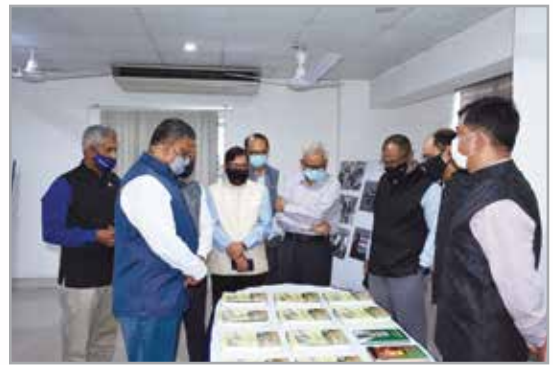
গণহত্যা দিবসে পুস্তক প্রদর্শনীতে উপস্থিত অতিথিবৃন্দ