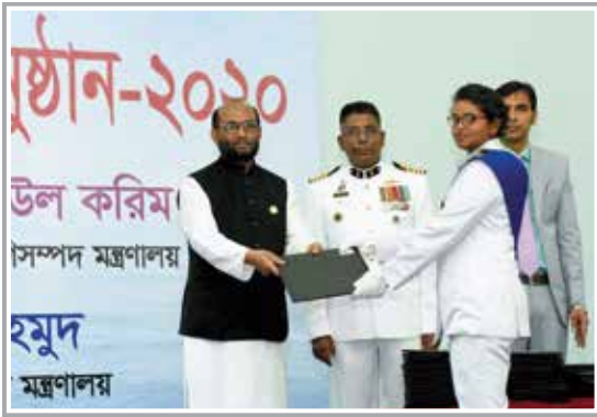
Certificate Awarding by Chief Guest