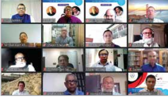
ওয়েবিনারের আমন্ত্রিত বিশেষজ্ঞ ও শিক্ষাবিদগণ

বঙ্গবন্ধু শেখ মুজিবুর রহমান মেরিটাইম ইউনিভার্সিটি, বাংলাদেশ এবং Nuffic OKP, Netherlands এর যৌথ উদ্যোগে ২২ এপ্রিল ২০২১ “Trajectories