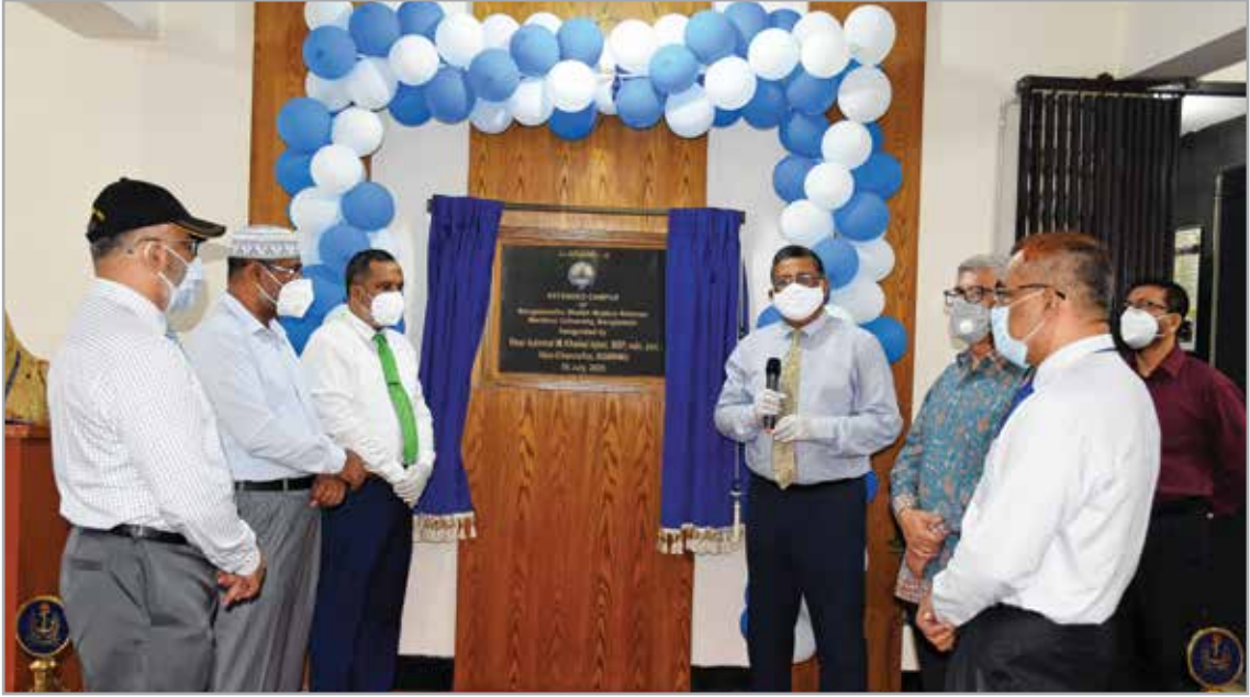
পদ্মা ভবন উদ্বোধনকালে মাননীয় উপাচার্য, শিক্ষক ও কর্মকর্তা বৃন্দ

বিএসএমআরএমইউ এর অস্থায়ী ভবন (পদ্মা) এর আনুষ্ঠানিক উদ্বোধন