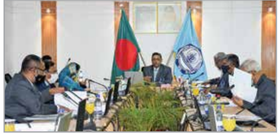
সিডিকেটের সম্মানিত সদস্যগণের আলোকচিত্র