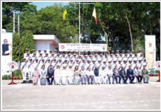
Group Photo of 39 th Batch