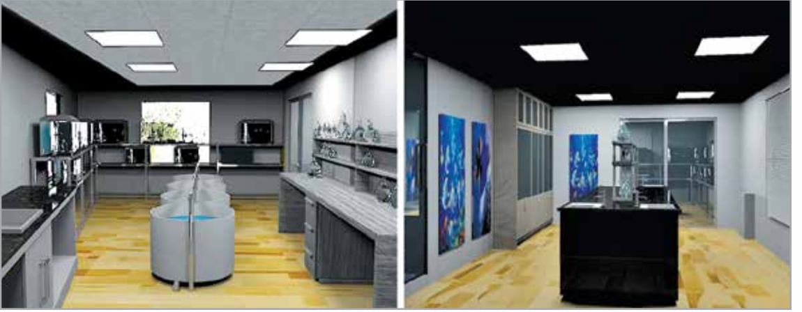
মেরিন ফিশারিজ ল্যাব

প্রকৌশল শাখার সার্বিক তত্ত্বাবধানে বিশ্ববিদ্যালয়ের আর্থ অ্যান্ড ওশান সায়েন্স অনুষদের অধীনে মেরিন ফিশারিজ ও অ্যাকুয়াকালচার বিভাগের শিক্ষার্থীদের ব্যবহারিক শিক্ষা প্রদানের উদ্দেশ্যে বিশ্ববিদ্যালয়ের অস্থায়ী ক্যাম্পাসের পদ্মা ভবনের ছাদে মেরিন ফিশারিজ ল্যাব স্থাপন করা হয়।