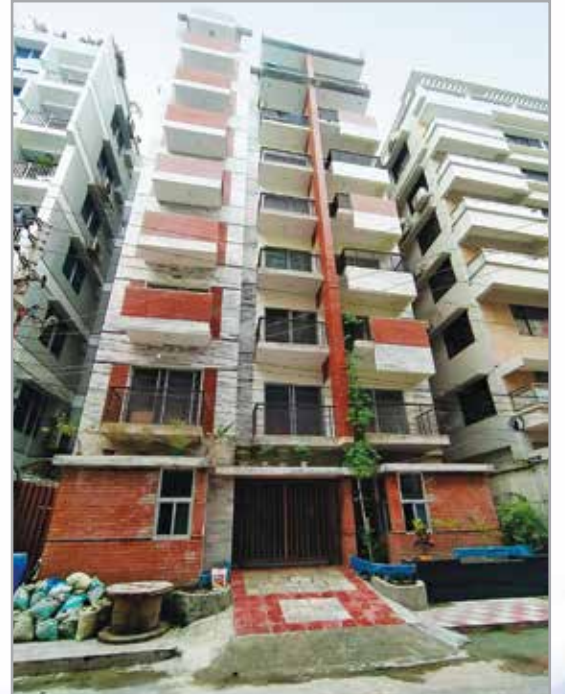
বিশ্ববিদ্যালয়ের শিক্ষার্থী হল

বর্তমানে অত্র বিশ্ববিদ্যালয়ের ২টি ছাত্র ও ১টি ছাত্রী হল রয়েছে। ছাত্র-ছাত্রীদের আবাসন সুবিধা নিশ্চিতকল্পে মার্চ ২০২০ হতে মিরপুর ডিওএইচএস-এ ৭ তলা বিশিষ্ট নতুন একটি ভবন ছাত্রনিবাস হিসেবে ভাড়া নেওয়া হয়েছে। হলগুলোতে মানসম্মত খাবারের ব্যবস্থা, বিনোদন, ইন্টারনেট এবং আসবাবপত্র স্থাপন করা হয়েছে। এছাড়াও হলগুলো পরিচালনায় হল প্রভোস্ট ও সহকারী প্রভোস্টের অতিরিক্ত দায়িত্ব প্রদান করা হয়েছে।