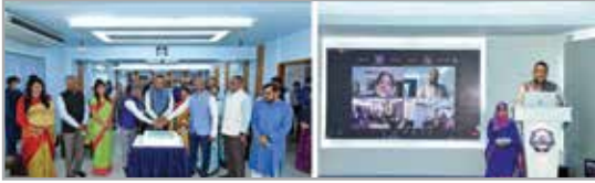
কেক কেটে জাতির পিতার জন্মশতবার্ষিকী উদ্‌যাপন