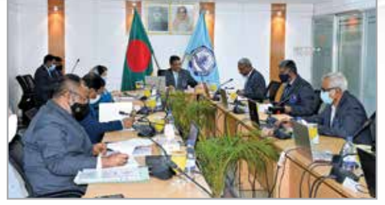
একাডেমিক কাউন্সিলের সম্মানিত সদস্যগণের আলোকচিত্র