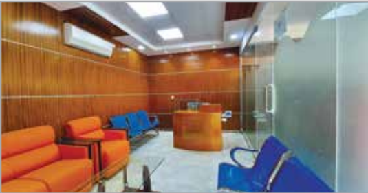
পদ্মা ভবনের রিসিপশন

প্রকৌশল শাখার সার্বিক তত্ত্বাবধানে বিশ্ববিদ্যালয়ের অস্থায়ী ক্যাম্পাসের পদ্মা ভবনের গ্রাউন্ড ফ্লোরে একটি রিসিপশন স্থাপন করা হয়েছে।