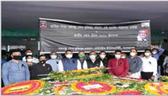
জাতীয় শোক দিবসে পুষ্পস্তবক অর্পণ