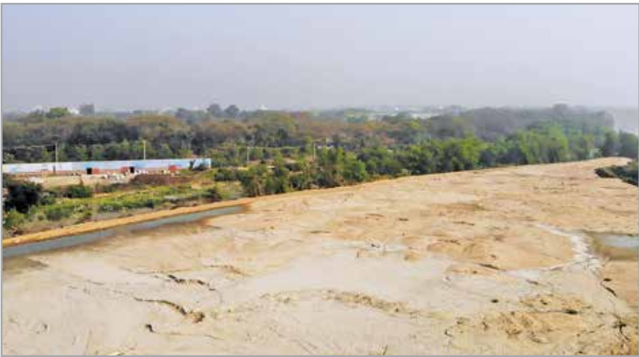
স্থায়ী ক্যাম্পাসের ভূমি