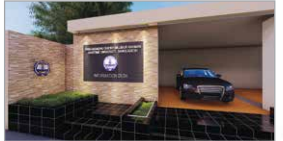
পদ্মা ভবনের ফেসিং ওয়াল

প্রকৌশল শাখার সার্বিক তত্ত্বাবধানে বিশ্ববিদ্যালয়ের পদ্মা ভবনের সম্মুখে দৃষ্টিনন্দন ফেসিং ওয়াল স্থাপন করা হয়েছে।