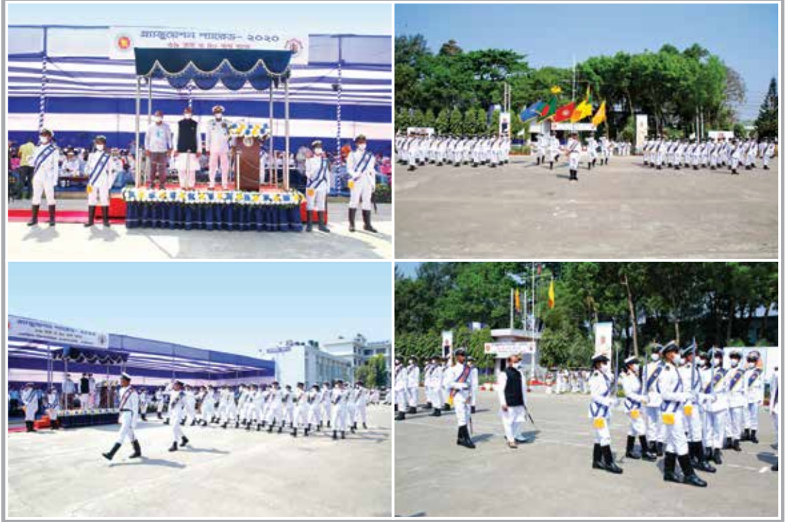
Graduation Parade of 39 th & 40 th Batch