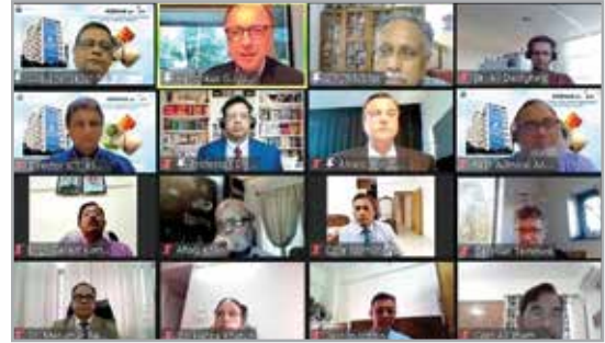
ওয়েবিনারের আমন্ত্রিত বিশেষজ্ঞ ও শিক্ষাবিদগণ