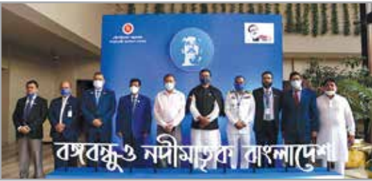
সেমিনারে অতিথিদের দলগত ছবি

জাতির পিতার জন্মশতবার্ষিকী উপলক্ষ্যে নৌপরিবহন মন্ত্রণালয় আয়োজিত “বঙ্গবন্ধু ও নদীমাতৃক বাংলাদেশ” শীর্ষক সেমিনারে বিশ্ববিদ্যালয়ের মাননীয় ভাইস-চ্যান্সেলর মহোদয়ের মূল প্রবন্ধ উপস্থাপন