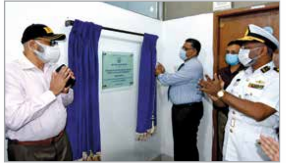
ভার্চুয়াল ক্লাসরুম উদ্বোধনকালে ভাইস চ্যান্সেলর মহোদয়