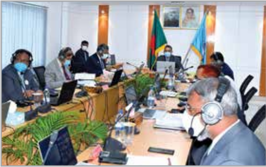
সিনেটের ৬ষ্ঠ সভার সম্মানিত সদস্যগণের আলোকচিত্র