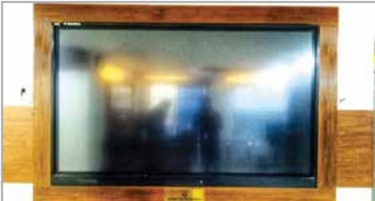
টাচ স্ক্রীন কিয়োস্ক