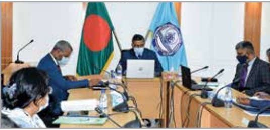
অর্থ কমিটির ২৫তম সভার সদস্যবৃন্দ