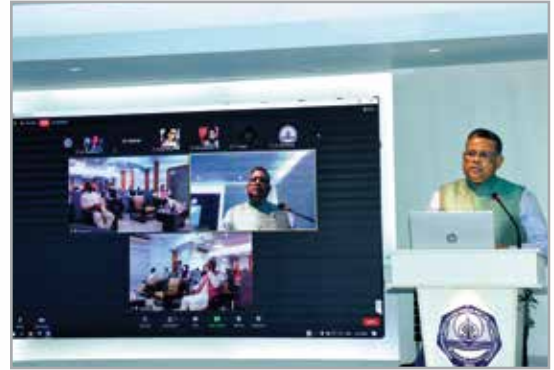
অনুষ্ঠানে বক্তব্যরত উপাচার্য মহোদয়