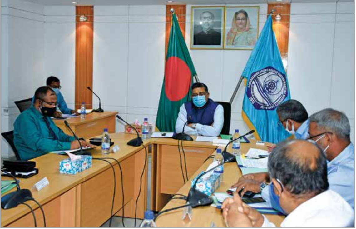
পরিকল্পনা, উন্নয়ন ও মূল্যায়ন কমিটির ৮ম সভার সদস্যবৃন্দ

বিশ্ববিদ্যালয়ের পরিকল্পনা, উন্নয়ন ও মূল্যায়ন কমিটির ৮ম সভা ১০ জুন ২০২১ অনুষ্ঠিত হয়। উক্ত সভায় Offshore Engineering এর উপর গুরুত্ব আরোপ করে সিলেবাস প্রণয়ন, সংশ্লিষ্ট মন্ত্রণালয়ের সাথে সমন্বয়পূর্বক প্রশিক্ষণ/সেমিনার আয়োজন, স্নাতক/স্নাতকোত্তর পর্যায়ে বৈশ্বিক উষ্ণায়ন নিয়ন্ত্রণ ও জিরো কার্বন নিঃসরণ সর্বোপরি কয়লার উপর চাপ হ্রাস করতে ওয়েভ এনার্জি, সমুদ্র শৈবাল, সমুদ্রের গভীরে গ্যাস ও তেল অনুসন্ধান সম্পর্কিত প্রোগ্রামসমূহ এবং Institute of Renewable Energy ঢাকার অস্থায়ী ক্যাম্পাসে চালু করা, স্থায়ী ক্যাম্পাসে দীর্ঘমেয়াদী ভূমি ব্যবহার পরিকল্পনা ও ভবিষ্যতের চাহিদা মাথায় রেখে বহুতল ভবনের নকশা পুনঃবিবেচনা করা এবং মেরিটাইম সেক্টরে দেশের একমাত্র বিশেষায়িত সরকারি বিশ্ববিদ্যালয় হিসেবে ছাত্র-ছাত্রীদের মধ্যে সচেতনতা ও আগ্রহ বৃদ্ধিকল্পে অস্থায়ী ক্যাম্পাস সম্প্রসারণে অনুমোদনের সুপারিশ করা হয়।