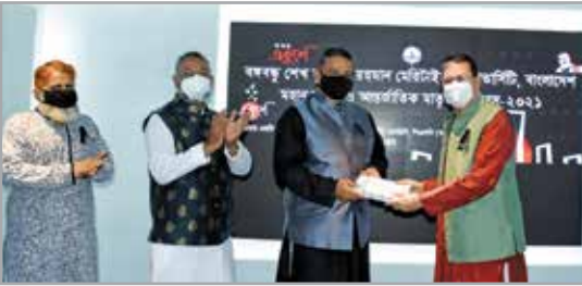
মহান শহিদ দিবসে উপাচার্য মহোদয়ের পুষ্পস্তবক অর্পণ ও স্মারক উপহার প্রদান