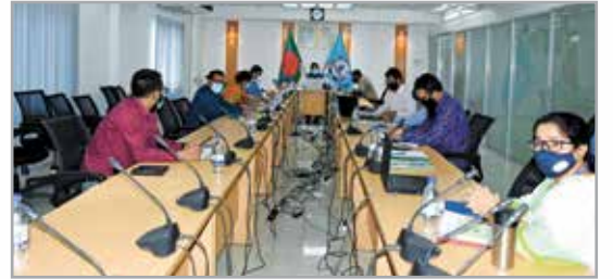
অর্থ কমিটির ২৬তম সভার সদস্যবৃন্দ