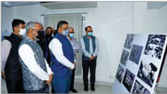
গণহত্যা দিবসে স্থির চিত্র প্রদর্শনী