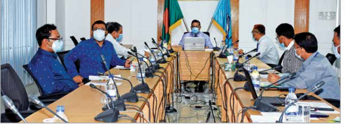
অর্থ কমিটির ২৪তম সভার সদস্যবৃন্দ