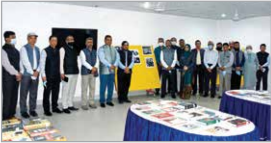
ঐতিহাসিক ০৭ মার্চ দিবসে পুস্তক প্রদর্শনীতে উপস্থিত অতিথিবৃন্দ

বিশ্ববিদ্যালয়ের কেন্দ্রীয় গ্রন্থাগার ও আর্কাইভ শিক্ষক-শিক্ষার্থীদের একাডেমিক তথ্যের চাহিদা পূরণে অগ্রণী ভূমিকা পালন করে আসছে। সময়ের পরিক্রমায় শিক্ষার্থীদের সংখ্যা বৃদ্ধির সাথে সাথে এর কলেবর বৃদ্ধি পেয়েছে। তাই বর্তমানে বিশ্ববিদ্যালয়ের মূল ভবনের পাশাপাশি পদ্মা ভবনে গ্রন্থাগারের আরও একটি শাখা চালু করা হয়েছে। ফলে শিক্ষার্থীগণ তাদের প্রয়োজন অনুযায়ী দুই গ্রন্থাগারই ব্যবহার করতে পারেন। বর্তমানে কেন্দ্রীয় গ্রন্থাগারে প্রায় ৭০০০ প্রিন্টেড বই, ৩০০ প্রিন্টেড জার্নালসহ অন্যান্য পাঠ্য সামগ্রী রয়েছে। তাছাড়া প্রায় ৬০০০ ই-বুক ও বিপুল সংখ্যক ই-জার্নাল রয়েছে। শিক্ষক-শিক্ষার্থীগণের চাহিদার সাথে সঙ্গতি রেখে এ সংগ্রহ প্রক্রিয়া চলমান রয়েছে।