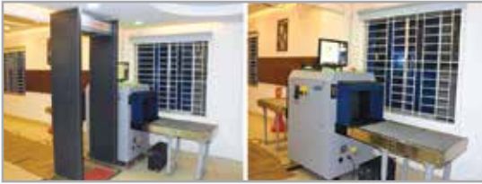
আর্চওয়ে এবং অত্যাধুনিক ব্যাগ স্ক্যানার

কম্পিউটার ল্যাব সম্প্রসারণ, অডিটোরিয়াম রেনোভেশন এবং শিক্ষকদের জন্য নতুন অফিস কক্ষ নির্মাণ ইত্যাদি। এছাড়াও নিরাপত্তার জন্য অত্যাধুনিক ব্যাগ স্ক্যানার, আর্চওয়ে এবং টাচ স্ক্রীন কিয়োস্ক স্থাপনসহ পোর্ট রেনোভেশনের কাজ সম্পন্ন করা হয়েছে।