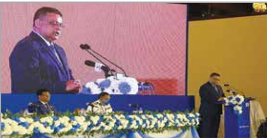
সেমিনারে প্রবন্ধ উপস্থাপন করছেন ভাইস-চ্যান্সেলর মহোদয়