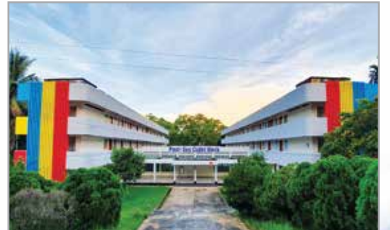
ভৌত অবকাঠামোর সৌন্দর্যবর্ধন ও আধুনিকায়ন