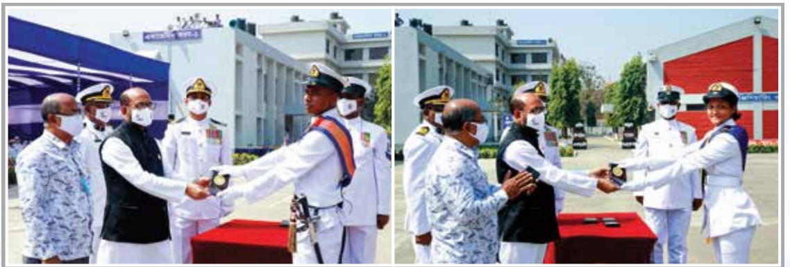
Gold Medal Award for Best Male & Female Cadet by Chief Guest