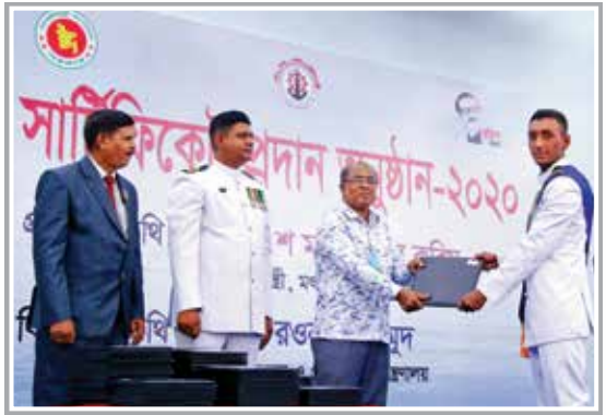
Certificate Awarding by Special Guest