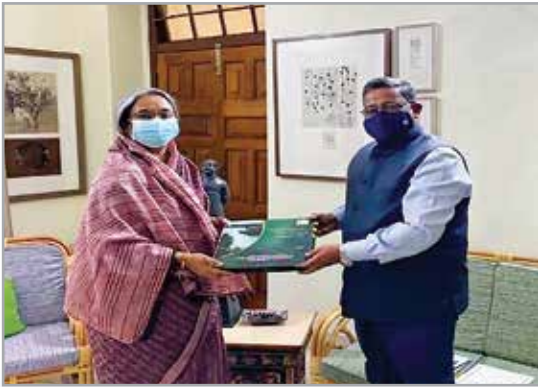
মাননীয় শিক্ষামন্ত্রীকে বিশেষ প্রকাশনা হস্তান্তর করছেন ভাইস-চ্যান্সেলর মহোদয়

“Sailing for Bangabandhu’s Maritime Bangladesh- Vision Inspiration & Realisation...” শীর্ষক একটি বিশেষ ও Illustrative Maritime Journal প্রকাশ